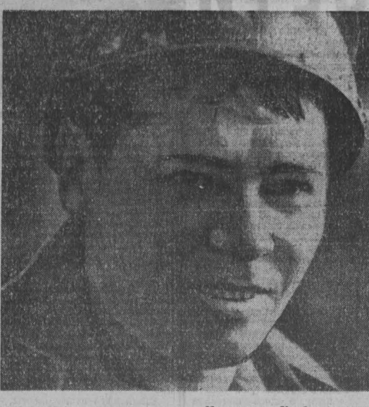
из почты РЕДАКЦИИ

Вот! — запротестовали булгаковцы. — Ракиятяны, вопорых, работали в родном забое, а, во вторых, к 7 часам прихватили немалого времени. Комиссия пришлось согласиться с этими доводами и назначить новый тур чемпионата. У булгаковцев было такое страстное желание победить, что они пожертвовали днем уже наступившего отпуска на участие в чемпионате.