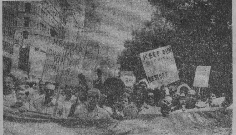
США. Многомиллионный Нью-Йорк оказался на грани банкротства. Городские власти в целях «экономики» закрывают больницы...