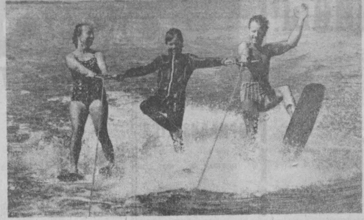
Белье Катера бороздит спокойную гладь воды. Подпрыгивая на волне, скользят за ними юные и взрослые. Это спортсмены московского спортивного «Малахита».

В правлении Госгудсервбасс СССР корреспонденту ТАСС сообщили, что в этом тираже на каждый разряд займа разыгрывается 9.400 выигрышей на сумму 512.560 рублей. Среди них — выигрыши по 5.000, 2.500, 1.000, 100 и 40 рублей.