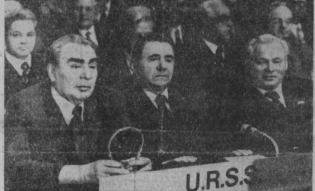
НА СНИМКЕ: советская делегация в зале заседаний. (ТАСС). (Снимок принят по фототелеграфу).

Сегодняшний день, продолжил президент Финляндской Республики, — это день радости и надежды для Европы. У нас есть все основания верить, что начинается новая эра в наших взаимных отношениях и что мы вступили на путь, который приведет через разрядку напряженности к стабильности и прочному миру.