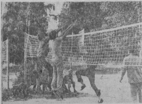
А вечером начинаются спортивные состязания, игры, диспуты, танцы. НА СНИМКАХ: так выглядят «Мечта»...