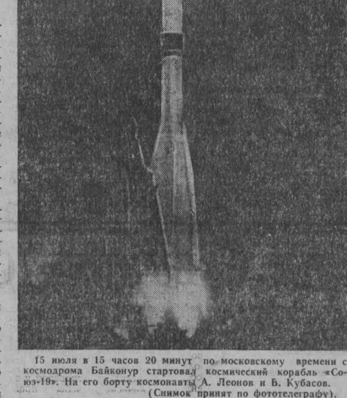
15 июля в 15 часов 20 минут по московскому времени с космодрома Байконур стартовал космический корабль «Союз-19».

историю лишь несколько часов. Зато в эти «звездные» часы были сделаны важнейшие открытия в астрофизике и геофизике.