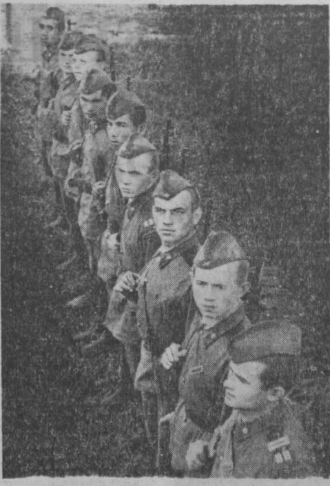
Недавно в части Краснознаменного Сибирского военного округа вступил в строй отряд призывников.

Ежегодно большую помощь оказывают березовским труженикам подшефного Кузнецкого района.