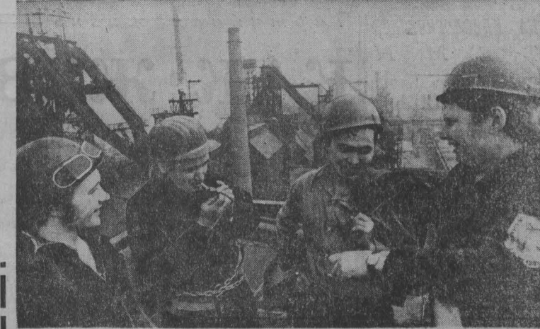
На Западно-Сибирском металлургическом заводе полным ходом идет реконструкция доменной печи № 1. По соседству с действующей сооружается высокотемпературная печь-испечьи...

Директор рассчитывает, что продукт дождя подрастет, а метелки механизированные звенья совхоза быстро управятся с заданием.