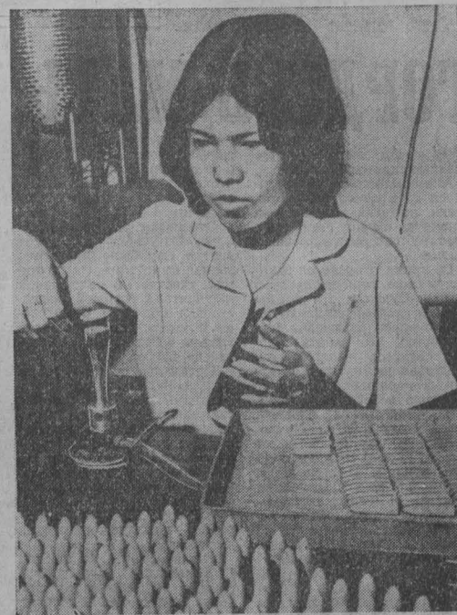
Женщины составляют почти половину населения многонационального Сингапура — двухмиллионной азиатской страны, расположенной на одном острове в водах Малаккского пролива. Они не только активные участницы строительства независимой республики, но и находятся в авангарде борьбы за равноправное положение в обществе.

Каковыми бы мы хотели видеть вас, ребята? Честными, хорошими людьми. И будьте всегда чуть-чуть недоверчивы собой: я еще мало сделал, не все успел. Только тогда вы сможете двигаться вперед. Застой в стремлениях, помыслах — это гибель для человека. Но не падайте духом, если сегодня не удалось добиться нужного результата. Соберите все силы и добейтесь своего. И цель ваша должна быть высокой, благородной. Любите свое дело, где бы вы ни работали. Школа старалась многое сделать, чтобы помочь вам выбрать профессию, определить свою дорогу в жизни. Вспомните, как наши шефы — работники КМЗ-1 треста «Сибметаллургмонтаж» — знакомили вас с профессиями своих городов, возили на свои объекты, вспоминали наши встречи с лучшими бригадами монтажников, наши общие комсомольские собрания. Но просто выбрать профессию — еще не все. Надо стараться в полную меру свои силы приносить пользы обществу. Мы хотим, чтобы вы высоко несли звание ЧЕЛОВЕКА. г. Кемерово.