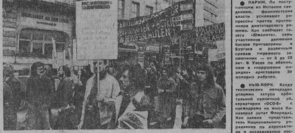
В ФРГ проходит выступления молодежи в защиту коммунистических принципов. Демонстрация протеста против безработицы в ФРГ. Маняфестация, организованная профсоюзами, приняли участие члены разных молодежных объединений.

Встреча показала, что сирийский народ высоко ценит усилия и помощь Советского Союза, который борется за свободу и независимость всех народов.