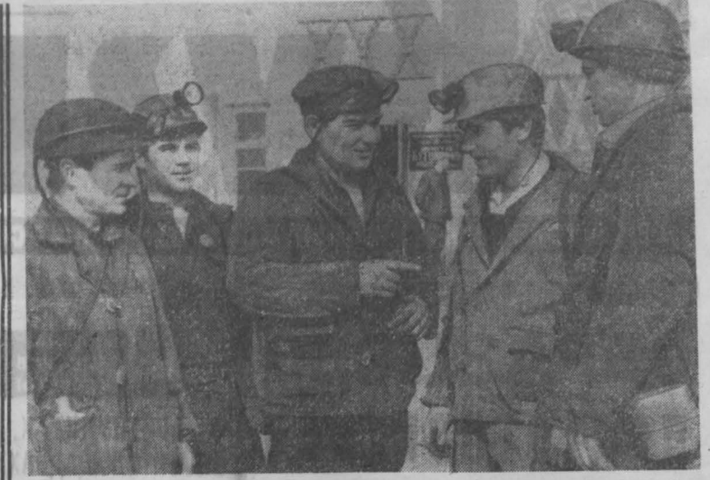
В апреле и мае коллектив шахты «Бутовская» выдал дополнительно к плану почти 16.000 тонн угля.