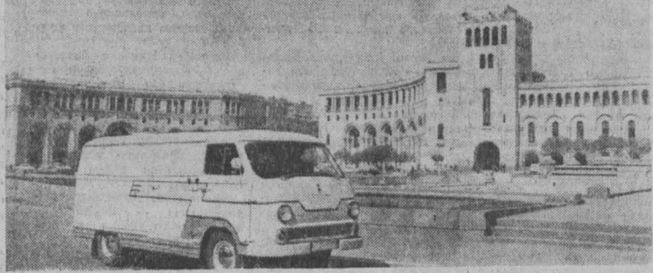
АРМЯНСКАЯ ССР. В проблемной лаборатории Ереванского политехнического института имени Карла Маркса разработан образец электромашины с комбинированной энергоустановкой (КЭУ).

Государственный Омский русский народный хор не первый раз гастролирует в Кузбассе, и каждый его приезд любители народной песни ждут как праздника.