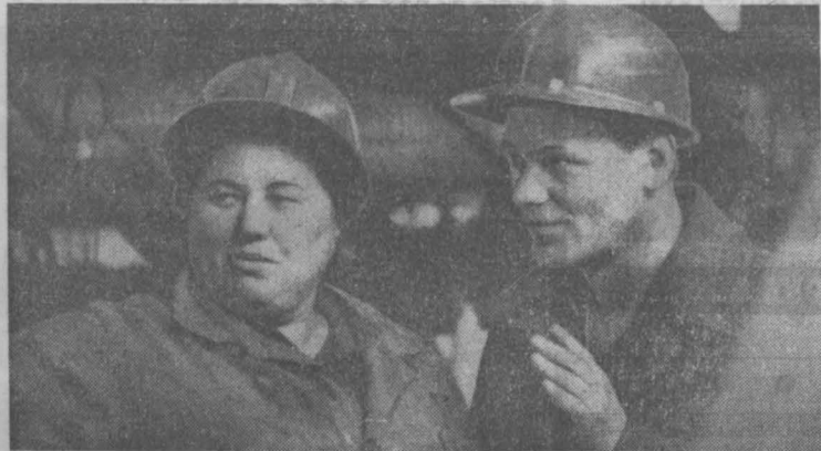
Ритмично трудится в завершающем году девяти пятилетки цех № 4-13 Кемеровского азотно-тукового завода. Все смени работало здесь с перевыполнением производственного задания.