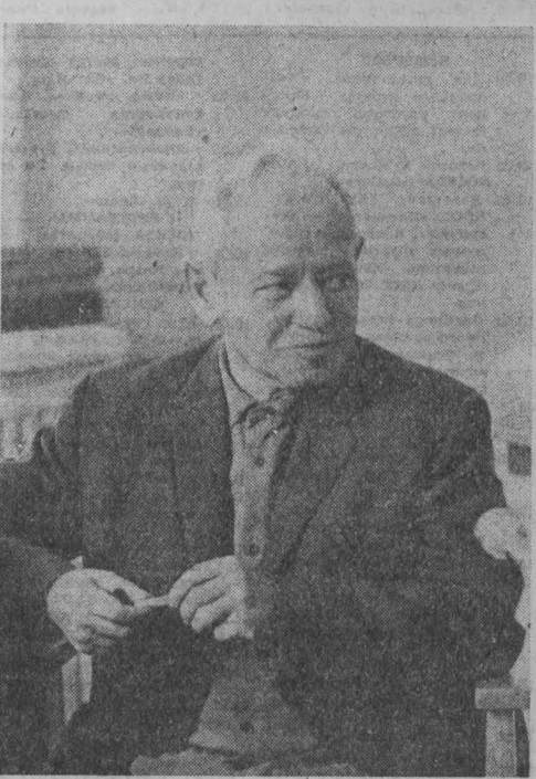
М. А. Шолохов

ОТВЕТ: Алексей Толстой как-то сказал, что прошедшая война способна вдохновлять писателей еще, по меньшей мере, двести лет. Наш народ заплясал за победу тяжелой ценой — дающей миллионами жизней. А чело кадек и