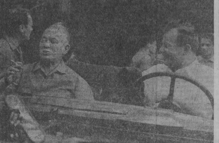
М. А. Шолохов и Ю. А. Гагарин.