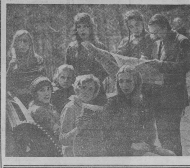
В начале этого учебного года в Кемеровском государ- ственном университете по- явилась новая специализа- ция — журналистика. Это значит, что 13 студентов-фи- лологов второго курса слу- шают все лекции, какие по- ложено по программе фа- культега. А два раза в неде- лю у них ведут занятия опытные журналисты. Принимали в группу, ко- нечно, только тех, у кого есть интерес к газетному де- лу. Но интерес — не един- ственный критерий. Нужны еще способности. Учитывали и их. Отделение журнали- стики на факультете обще- ственных профессий, много лет существовавшее в вузе, помо- ло более или менее верно отобрать людей. Пройдет несколько лет — и подрастет смена. В город- ские и районные газеты об- ластного придуку молодежи, под- готовленные кадры. И. ЗОЛИНА, НА СНИМКЕ: будущие журналисты, а пока студен- ты второго курса филологи- ческого факультета Ке- меровского государственного университета.

Когда на обратном пути мы вышли на развилку, то еще издали увидели, что ма- шина нас ждет». Поляна, где похоронен Доронин в братской могиле, — живой памятник второй мировой войны. Она зарита воронками от бомб и снарядов. Траншеи и окопы сохра- нены, как были во время боев. Правда, теперь зарос- сло травой и полевыми цветками. Большая братская могила вместе с памятником обве- сена оградой. Два раза в году — 13 августа, в день освобождения Смоленщины от немецких захватчиков, и 9 мая, в День Победы, съезжаются сюда однополча- ны, приходит матери и же- ны, дети и родные. Море венков и цветов, и надпись на памятнике: «Слава вам, храбрые. Слава вам, бес- страшные. Вечную славу по- ст вам народ, доблестно жни- шим, смертью сокрушающим, вечная память о вас не ум- рет». З. КОПЫЛОВА, сотрудник общественной приемной «Кузбасса».