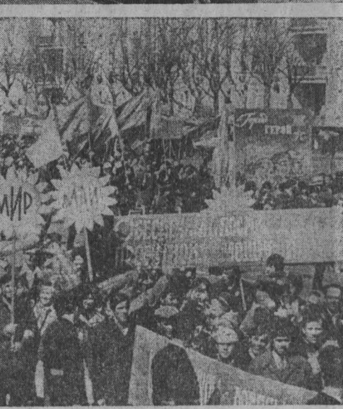
На снимках: первомайская демонстрация в Кемерове.