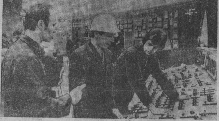
Самой крупной тепловой электростанцией Германской Демократической Республики будет ТЭС в Бонксберге (округ Котбус). В текущем году здесь состоится ввод в эксплуатацию трех последних энергоблоков второй очереди мощностью 210 мегаватт каждый. По окончанию строительства электростанция общей мощностью 3,500 мегаватт станет крупнейшей в Центральной Европе на станции, работающей на буром угле.

ТОКИО, 29. (ТАСС). Итоги выборов в местные органы власти в прошедшее воскресенье свидетельствуют о росте влияния прогрессивных сил Японии — прежде всего коммунистов и социалистов. Представители оппозиционных партий и кандидаты, пользовавшиеся под-