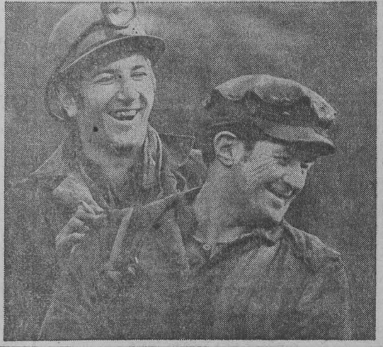
г. Прокопьевск, Кемеровская область.