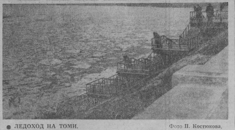
ЛЕДОХОД НА ТОМИ.

ИЗДАТЕЛЬСТВО «КУЗБАСС» ПРИГЛАШАЕТ НА РАБОТУ