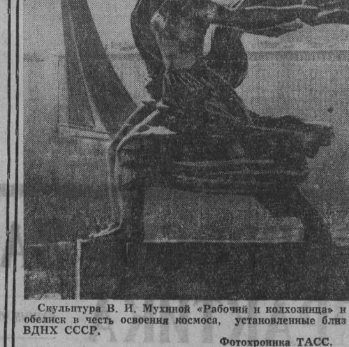
Скульптура В. И. Мухомина «Рабочий и колхозница» и обелиск в честь освоения космоса, установленные близ ВДНХ СССР.

В праздничном убранстве — Одесса. Огромные стеллы с фотографиями, яркие транспаранты повсюду от 30-летия ратного подвига у естои, о трудовой славе черноморцев.