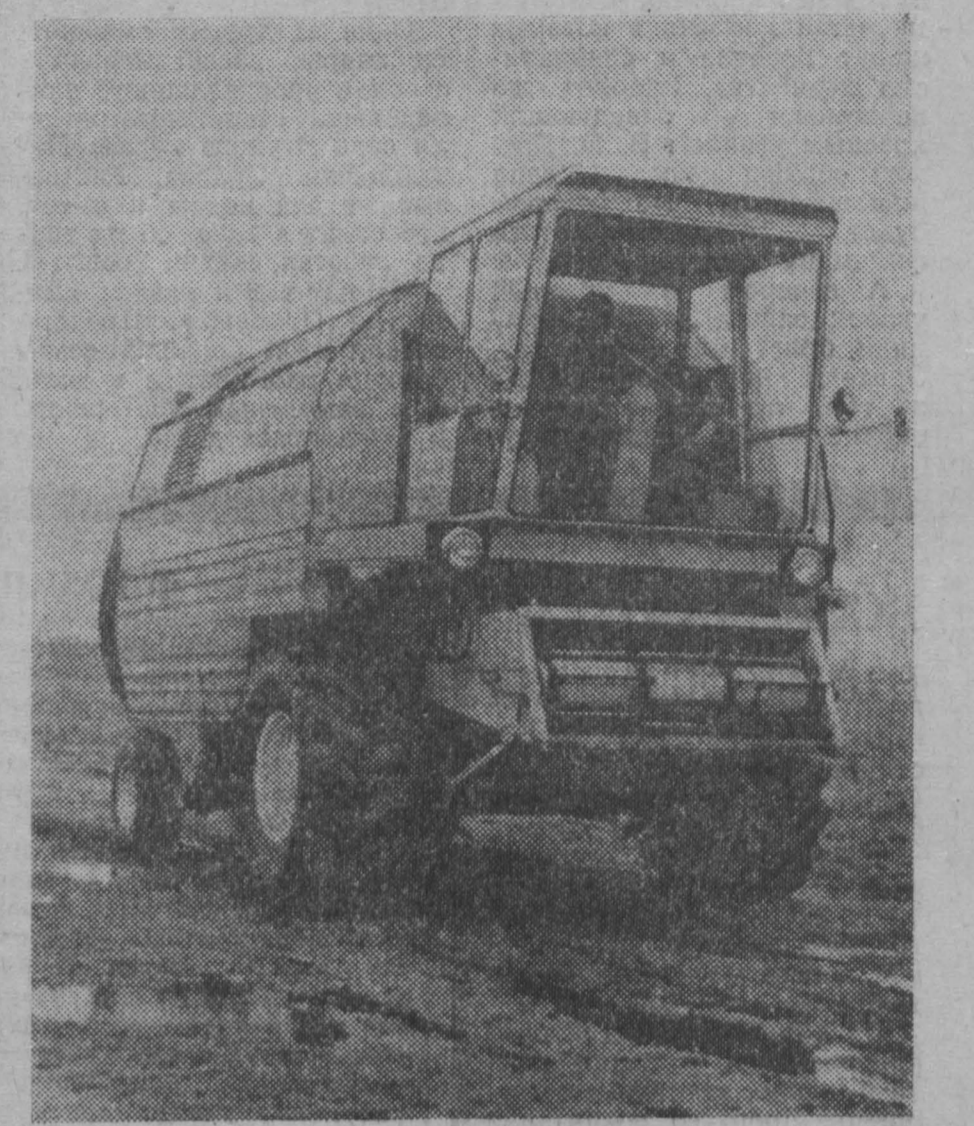
Около 150 сельскохозяйственных машин производят промышленность народной Польши.

Народного единства. В ближайшее время в руки бывших хозяев перейдут еще 40 предприятий. Одновременно хунта ведет наступление на права трудящихся. В угоду предпринимателям она повышает цены. За два первых месяца текущего года дороговизна в стране возросла на 40 процентов.