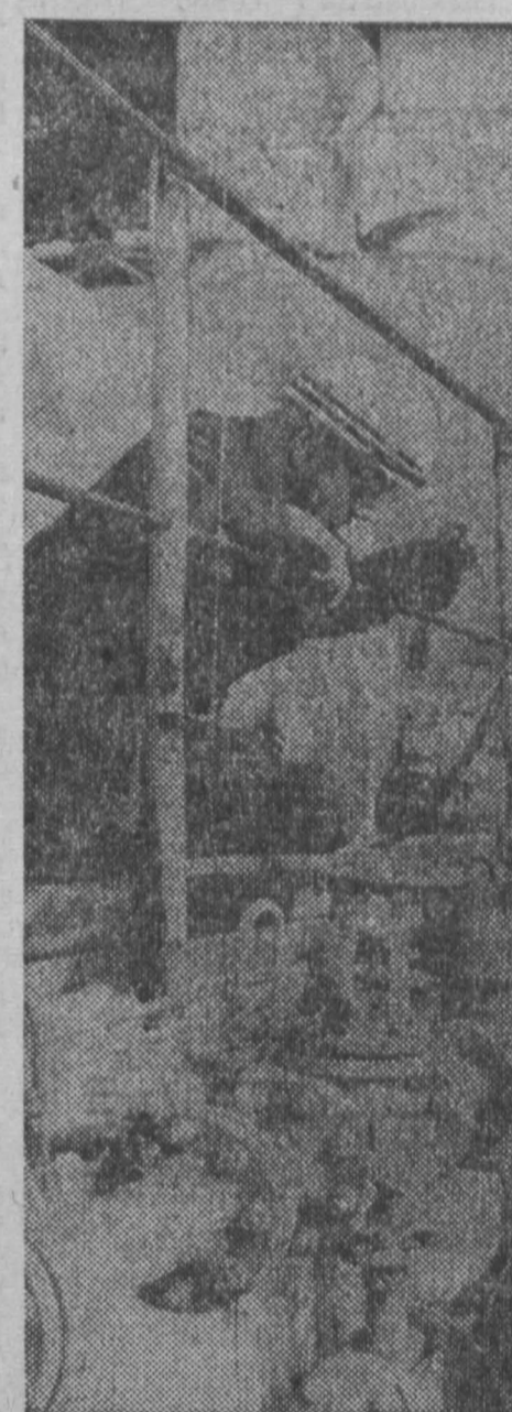
В Германской Демократической Республике дала ток атомная электростанция

В свою очередь значительно возрастает и советские поставки комплектного оборудования в Польшу Народную Республику, как, например, оборудование для металлургических предприятий, домостроительные комбинаты и др.