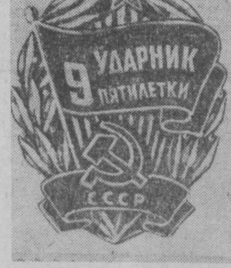
Знаком «Ударник девятой пятилетки».