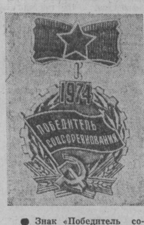
Знаком «Победитель социалистического соревнования 1974 года».