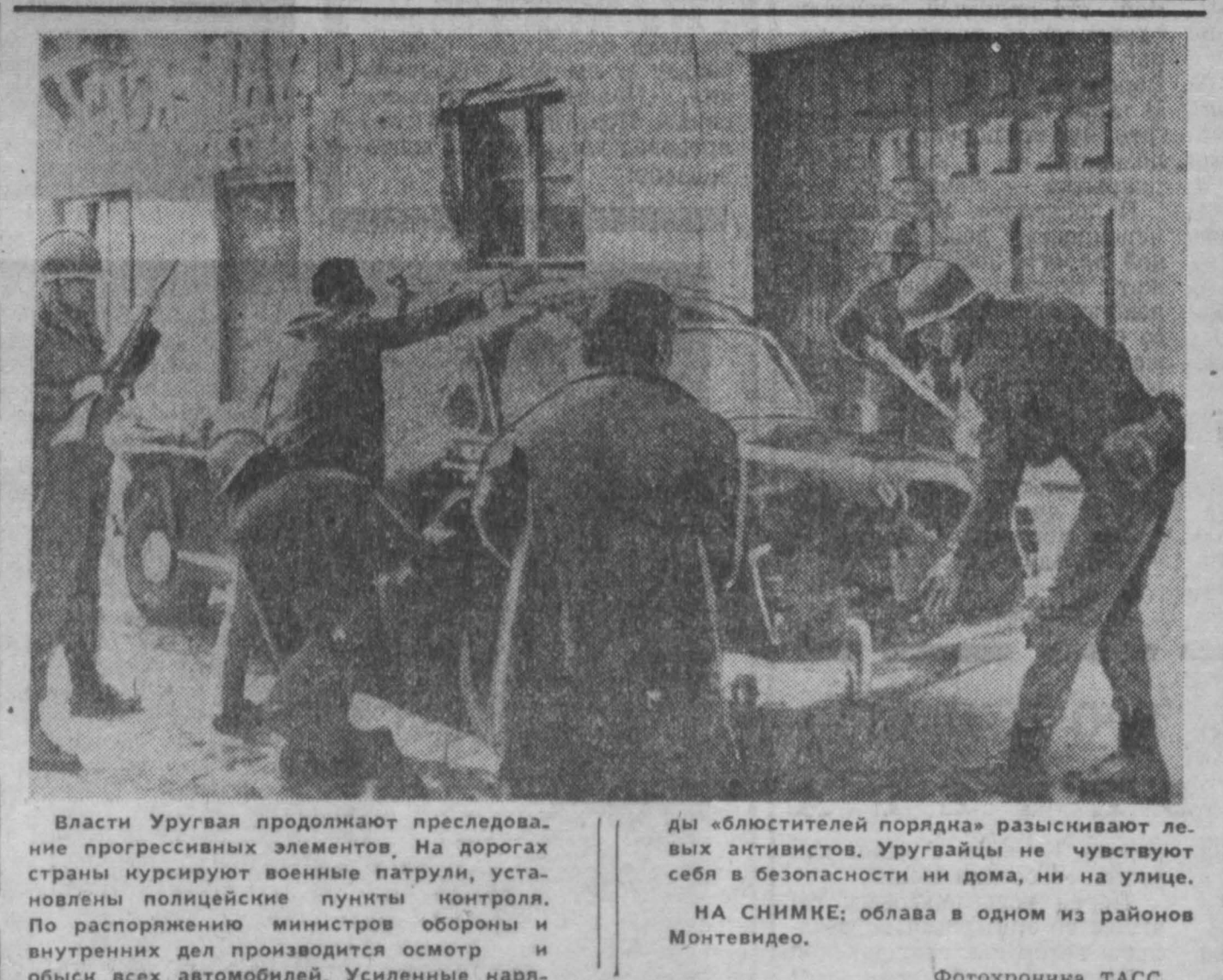
Власти Уругвая продолжают преследовать прогрессивных элементов. На дорогах страны курсируют военные патрули, усилены полицейские пункты контроля.

Гессен вынудил предпринимателей удовлетворить требования трудящихся о повышении заработной платы и улучшении условий труда.