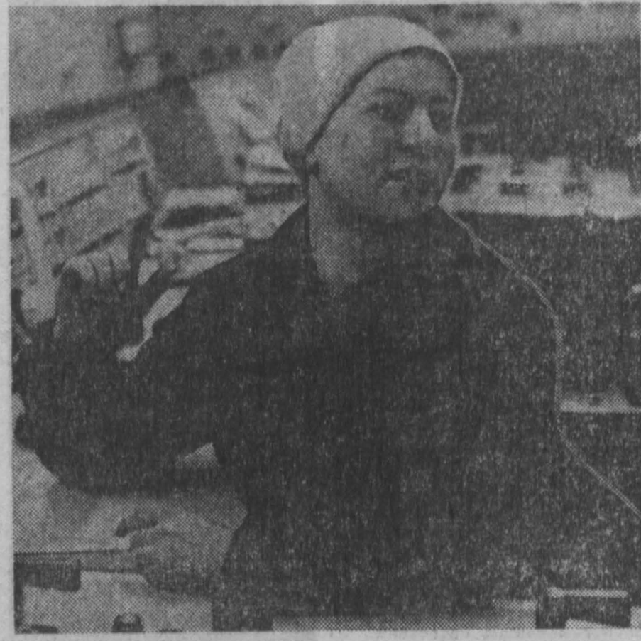
Начался завершающий, самый ответственный этап на строительстве крупнейшего в стране испорочно-конвертерного цеха № 2 Западно-Сибирского металлургического завода.