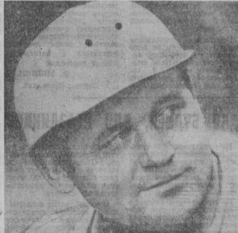
НА СНИМКЕ: слесарь по ремонту оборудования Мушкетерского аэродромного завода...