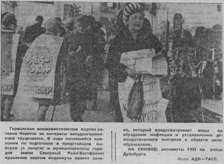
Германская коммунистическая партия активно борется за интересы западных рабочих трудящихся. В ходе называемой кампании по подготовке к предстоящим выборам (в ландтаг и муниципалитеты городов земли Северный Рейн-Вестфалия) правление партии выдвинуло проект закона, который предусматривает меры по обузданию инфляции и установлению демократического контроля в области ценообразования.