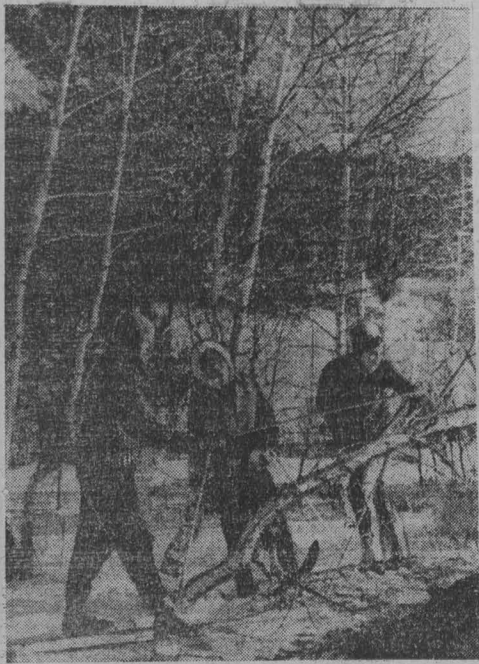
ПО ПЕРВОМУ СНЕГУ...