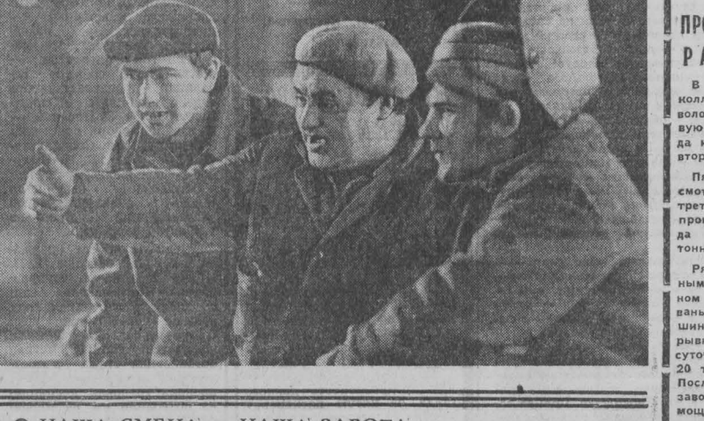
Наша смена — наша забота