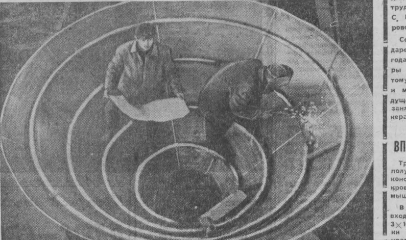
Производство цеха № 3 кемеровского завода «Химмаш» идет на многие химические предприятия нашей страны. Здесь изготавливаются резервуары различных конструкций и размеров.