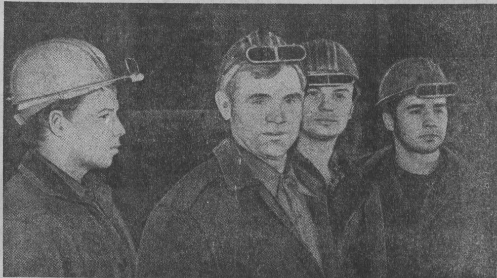
Одним из лучших мартеровских агрегатов на работу животноводов комбинате имени В. И. Ленина является печь № 2. Взятые коллективом стальные варады обещают сварить за год 2,5 тысячи тонн металла дополнительно к заданию успешно выполняются. На их сверхплановый счет уже более двух тысяч тонн высококачественной стали. Каждая третья плавка на агрегате сварена скротными методом.