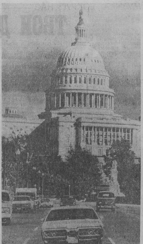
ВАШИНГТОН. Капитолий — здание конгресса США.

● СОФИЯ. В болгарской столице состоялось заседание бюро Международной Федерации борцов Сопротивления (ФИР). В нем приняли участие представители 19 стран. ● БУХАРЕСТ. Закончились работы по прокладке второй линии на железнодорожной магистрали Бухарест — Брашов — Сибишоара — Теюш — Клуж протяжением 500 км. ● РИМ. Здесь состоялось первое заседание нового состава руководящего комитета общества «Италия-СССР», избранного на VII конгрессе общества в Сиене. Генеральным секретарем общества вновь избран сенатор, коммунист Джелеззо Адамони. ● ЛОНДОН. Английское правительство опубликовало зеленую книгу, в