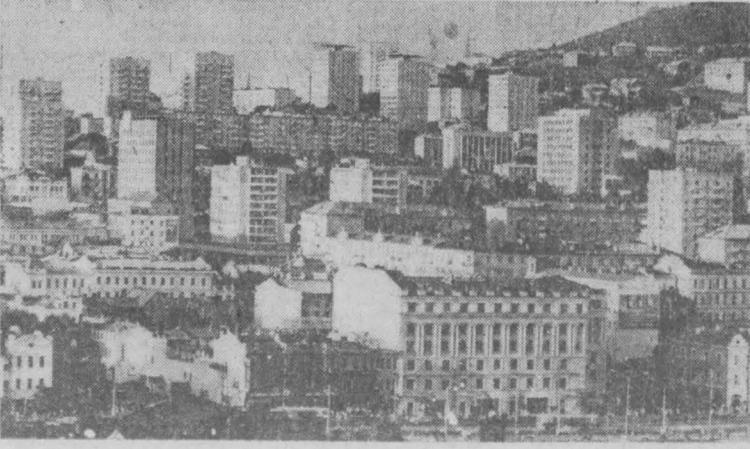
ВЛАДИВОСТОК. Улица Ленинская.