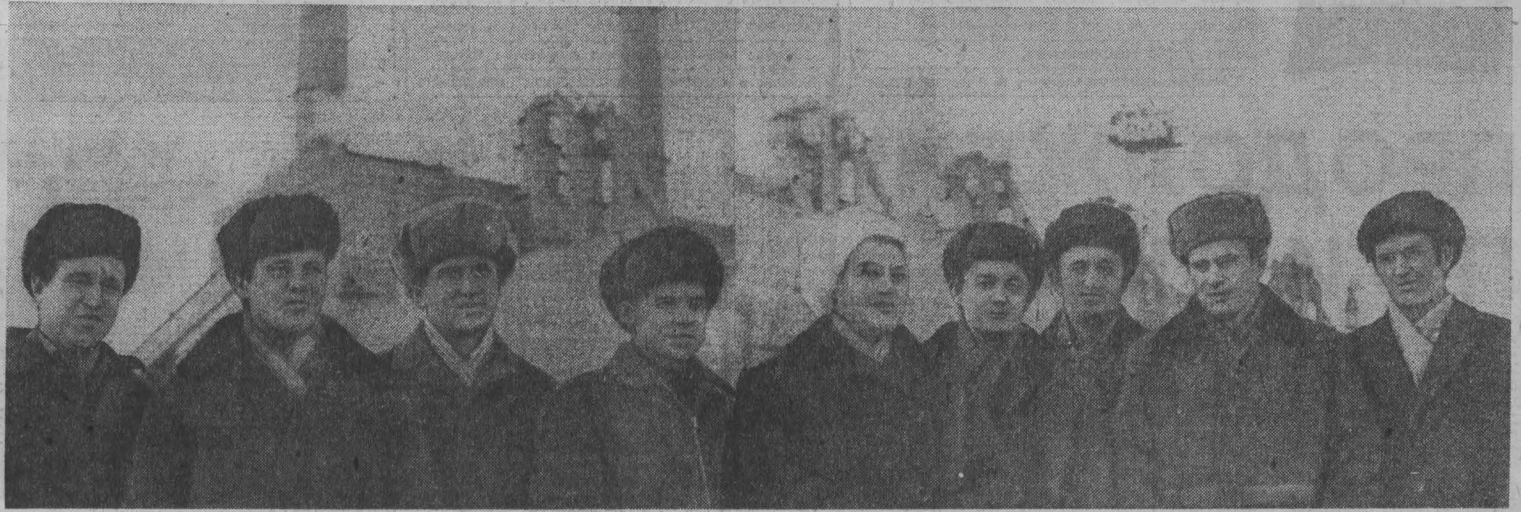
Мнение рабочего о соревновании

В большом зале обкома партии состоялось первое заседание областной школы идеологического актива по проблемам теории и методов идеологической работы. Она создана в соответствии с требованиями постановления ЦК КПСС «О работе по подбору и воспитанию идеологических кадров в партийной организации Белоруссии». Слушатели школы — секретари горкомов и райкомов КПСС по идеологическим вопросам, заместители председателей исполкомов городских и районных Советов, ведущие отделы пропаганды и агитации горкомов и райкомов КПСС, их заместители, заместители секретарей партийных комитетов крупных предприятий. Рассматривался вопрос о ходе выполнения мероприя-