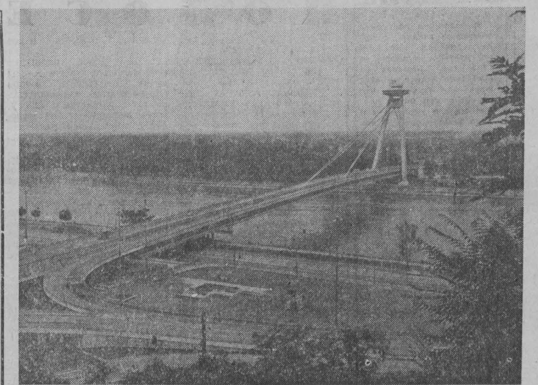
ЧЕХОСЛОВАКИЯ. Мост через Дунай в Братиславе, соединяющий центральную и западную части города. Своеобразная конструкция 430-метрового моста, подвешенного на одном громадном пилоне, не имеет себе равных в Европе. Ширина его — 20 метров. Уникальным сооружению присвоено имя Словацкого национального восстания.