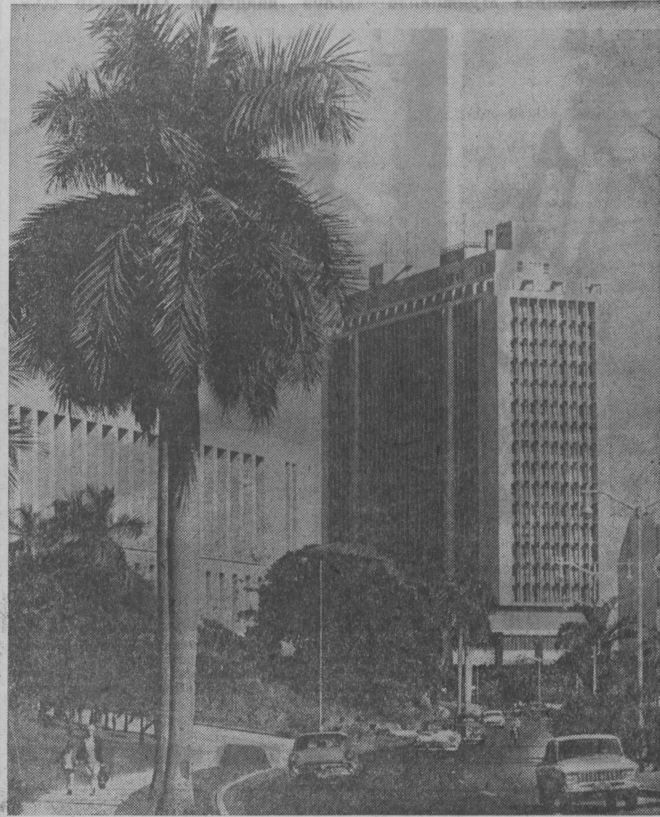
На одной из магистралей Гаваны.

План строительства культурного комплекса в центре македонской столицы предусматривает сооружение народного театра на тысячу мест, большого и малого залов филармонии, двух музыкальных и одной балетной школы, большого кинотеатра на 1.120 мест. Комплекс, строительство которого в разгаре, должен быть закончен к 1976 году.