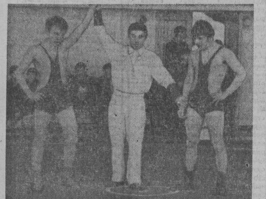
В кемеровском спортивном комплексе «Ириовец» закончилось состязание борцов вольного стиля на первенство ДСО профсоюзов среди юниоров. В номинации зачете победу одержали спортсмены Ижевска. На втором месте — кемеровчане. Шесть наших спортсменов вошли в состав сборной ДСО профсоюзов и получили путевку на участие в первенстве ВЦСПС.