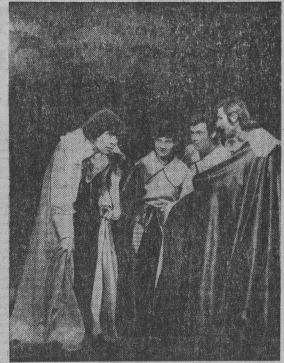
Сцена из спектакля «Сирано де Бержерак».

Ведь форма постановки выбрана необычная — три исполнителя роли Сирано предстают перед нами, каждый из которых расширяет определенную тему. И этих трех не только внешне непохожих друг на друга героев наше вообра-