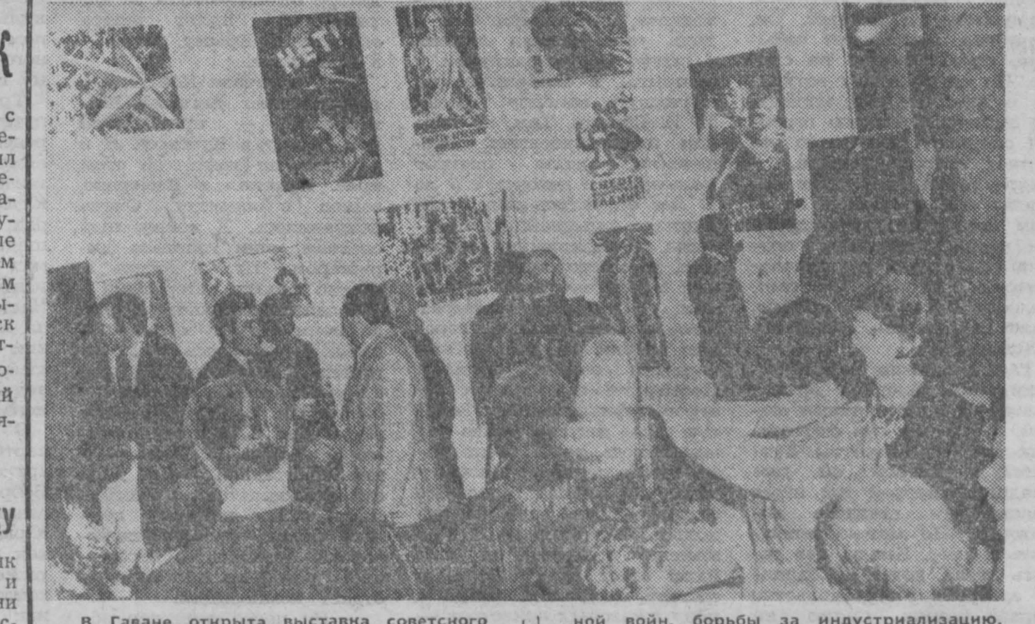
В Гагане открыта выставка советского политического планета (на снимке). На ней представлено 400 работ советских художников, отображающих широкую панораму героической истории советского народа; в дни гражданской и Великой Отечественной войн, борьбы за индустриализацию. Ряд планов посвящен теме борьбы против империализма, за международную солидарность, сотрудничество с кубинским народом.

ла — в течение 12 дней, с 22 февраля по 5 марта. Генерал аль-Гамаси сообщил также о том, что оставшиеся израильскими войсками территории сначала будут занимать чрезвычайные силы ООН, которые передадут ее египетским войскам. Контроль за выводом израильских войск будет осуществляться патрулями ООН, в состав которых включены египетский и израильский офицеры связи.