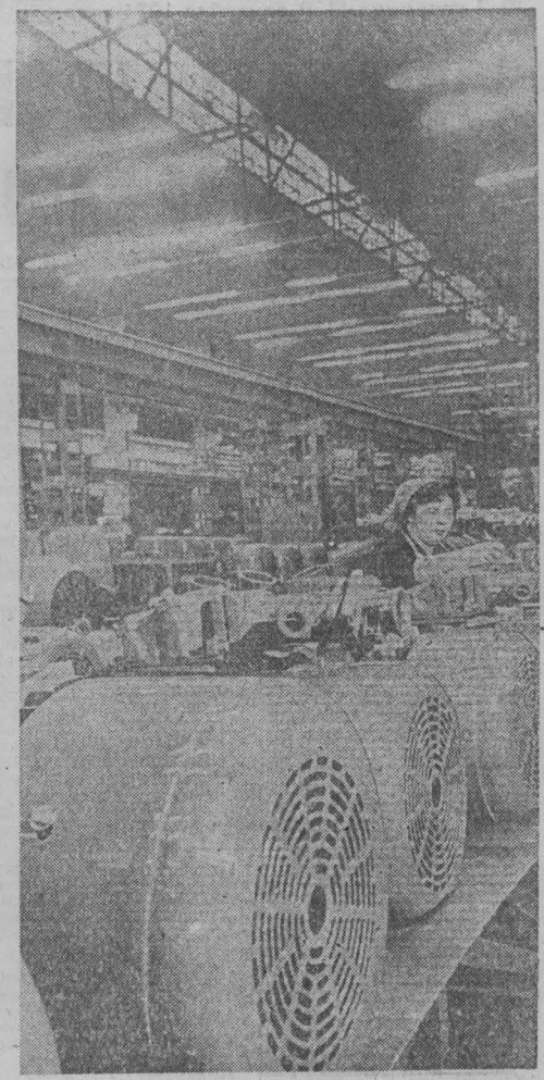
Кемеровский завод «Кузбассэлектромотор» выпускает электродвигатели различных габаритов и пускатели во взрыво-безопасном исполнении для угольной и химической промышленности. Продукция пользуется большим спросом в нашей стране и за рубежом. В 50-е и 60-е годы стран мира отгружалось электродвигатели и пускатели с маркой «КЭМЗ». Коллектив успешно заканчивает третий квартал по выпуску экспортной продукции.

Газета основана в январе 1922 года. № 229 (14340) Воскресенье, 29 СЕНТЯБРЯ 1974 года. Цена 2 коп.