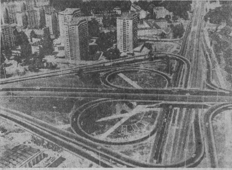
ВАРШАВА. Новая Лазенковская магистраль в польской столице соединила западную и восточную части города.