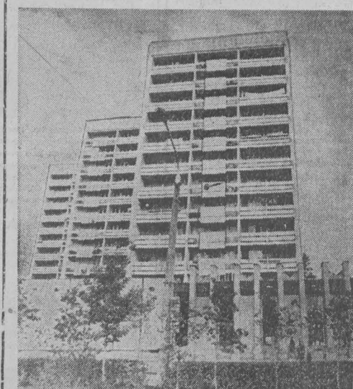
НОВОКУЗНЕЦК. Красивый архитектурный ансамбль вырос на углу проспекта Дружбы и улицы Кирова. Недавно здесь открылся новый магазин «Киниги». В магазине просторный торговый зал, красивое оформление, покупатели найдут здесь большой выбор художественной и политической литературы.

эксплуатационный рейс. Им началась серия поездок, которые предстоит совершить скоростному поезду для опробования в движении вагонов и их оборудования.