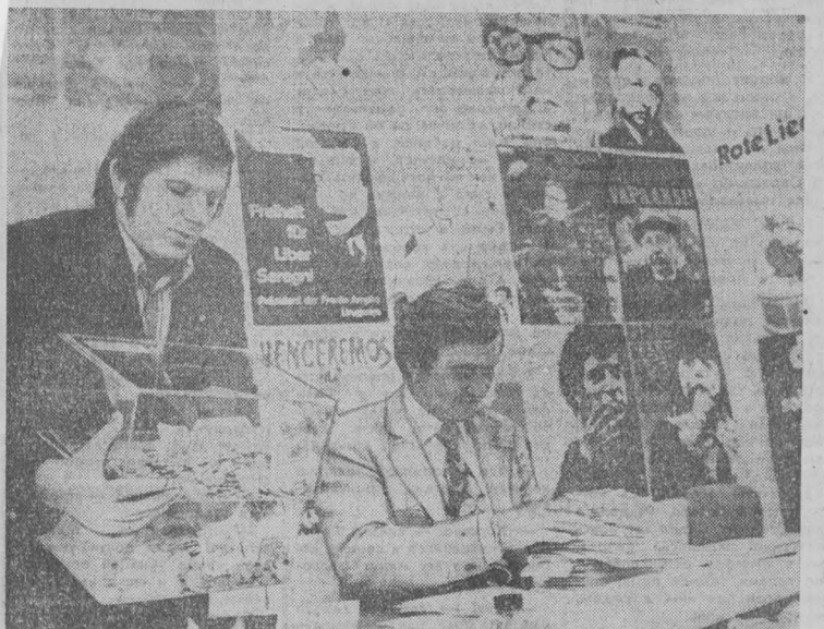
ГДР. В адрес Центра солидарности с народом Чили поступают пожертвования, письма, телеграммы от трудя-