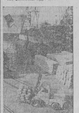
МУРМАНСК. Горняки пора сейчас у мурманских портов. В Мурманске суда принимают в трюмы мелезородный концентрат, грузы для арктических станций. Круглые сутки идет загрузка в советские и иностранные суда высококачественного платинового концентрата, выработанного в Хибинах.