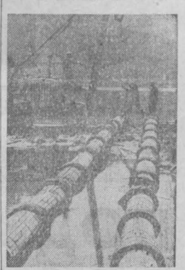
ХАБАРОВСКИЙ КРАЙ. На Комсомольском-на-Амуре нефтеперерабатывающем заводе идет реконструкция и расширение производства. Для обеспечения новых мощностей сырья производится вторичная переработка Ох-Комсомольск.