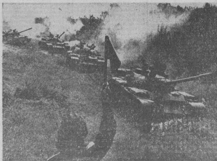
НА СНИМКЕ: танковая рота на марше.