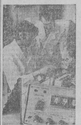
МОСКВА. В научно-исследовательском Институте интроскопии создан первый в нашей стране прецизионный ультразвуковой толщиномер с цифровым отсчетом УТ-30П. Он предназначен для контроля толщин заготовок изделий и готовых конструкций из любых металлов, различных пластмасс и керамики во многих отраслях промышленности. Прибор может измерять толщину от двух десятых миллиметра до 100 миллиметров при одностороннем расположении датчика относительно изделия. НА СНИМКЕ: идут испытания.