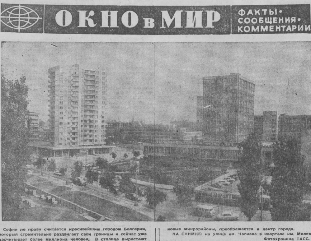
Сofия по праву считается красивейшим городом Болгарии, который стремительно раздвигает свои границы и сейчас уже насчитывает более миллиона человек. В столице вырастают новые микрорайоны, преобразуется и центр города. НА СНИМКЕ: на улице им. Чапаева в квартале им. Милева.