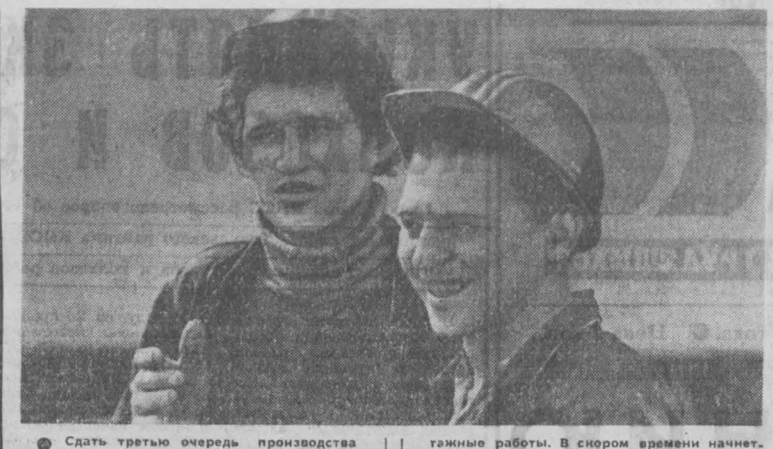
Сдать третью очередь производства юрдной ткани на Кемеровском заводе химического волокна в декабре этого года — так решили его строители.