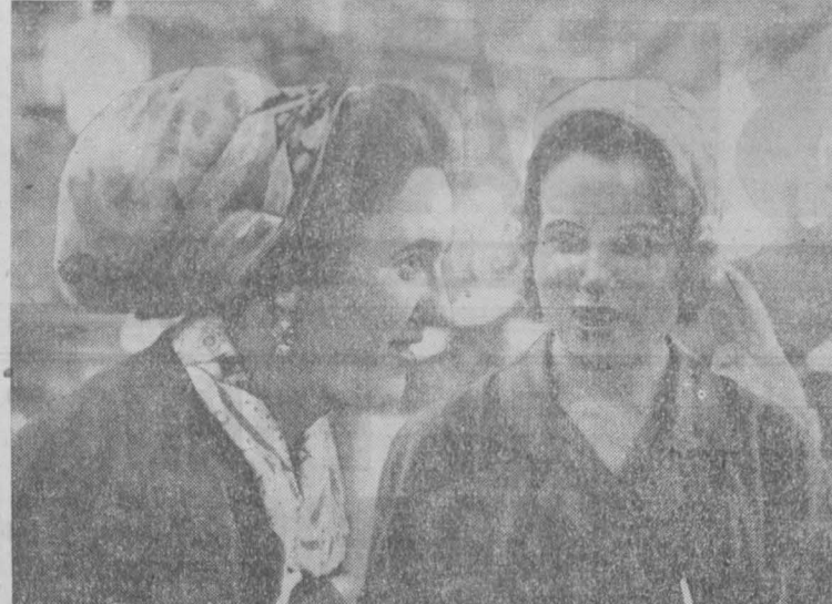
Хорошо потрудились прессовщицы цеха № 3 кемеровского завода «Карболит» в минувшем месяце. Они досрочно закончили план августа. Выдали с начала этого года сверхплановой продукции на 132 тысячи рублей. Производительность здесь по сравнению с 1973 годом возросла на 6,5 процента. Многие прессовщицы уже выполнили свои личные пятилетки.

однако ассортимент не расширяет. «По инерции» здесь выпускается электроразетка, которая стала уже никому не нужной и не обеспечена договорами на сбыт. План в ассортименте не выполняет анионно-прасочный завод. Неудовлетворительно занимается товарами для народа завод «Химмаш», хотя бюро горкома КПСС в декабре прошлого года обязало руководителей завода осанить участок для выпуска таких товаров и начать их производство в 1974 году. На заводе химволокна план выпуска товаров народного потребления в нынешнем году ниже уровня, достигнутого в 1972 году. Новое крупное предприятие — комбинат шелковых тканей — в перспективе значительную часть своей основной продукции должен выпускать для народа. Первоочередной задачей его руководителей является быстрое окончание строительства и сдачи в эксплуатацию первой очереди отделочных цехов.