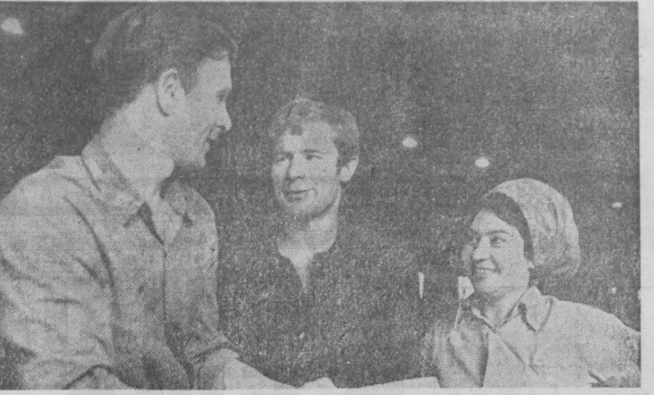
Четвертая конковая батарея, сооружаемая на Кемеровском коксохимическом заводе, — пусковая 1974 года. Сейчас здесь трудятся огнеупорщики из различных городов страны. Кроме Кемеровского и Кузнецкого управлений, работают специалисты из Караганды, Череповца, Липецка и Нижнего Тагила. Оноло дуеток огнеупорщиков и вспомогательных рабочих ведут лекции, к 10 сентября здесь закончат сооружение тридцати печей — это почти 50 процентов.