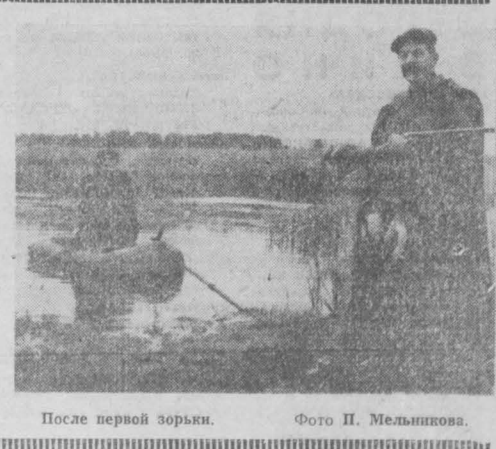
После первой зорьки.