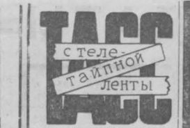
БУДАПЕШТ. Не менее 27 млн. тонн угля дадут в нынешнем году народному хозяйству шахтеры Венгрии. К 1985 году добычу угля в республике намечается увеличить до 40,5 млн. тонн.

СНРМ, продолжала она, была в числе первых молодежных организаций ФРГ,