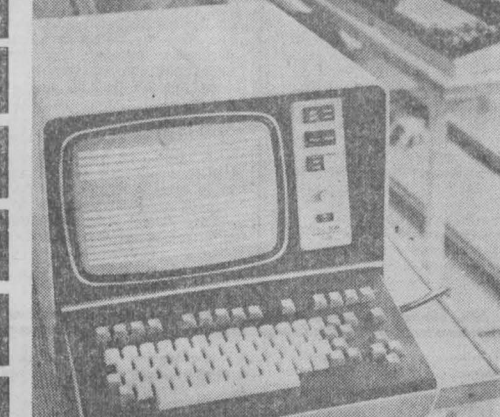
Известный завод радио- и телевизионной аппаратуры «Видеотон» в городе Сенешфехераре стал за последние годы крупнейшим предприятием венгерской электроники.

Республика экспортирует электронную технику в Советский Союз, Чехословакия, ГДР и другие социалистические страны. В рамках СЭВ Венгрия специализируется на выпуске малых ЭЭМ типа «Р.10», которые изготавливаются на высоком техническом уровне.