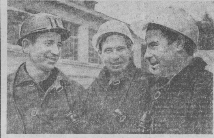
В текущей пятилетке проходчики шахты «Северная» смогли увеличить темпы добычи основных горных выработок, что позволило создать стабильный очистный фронт.

К. КАЛИНИН, спец. корр. «Кубасса», Чебулинский район.