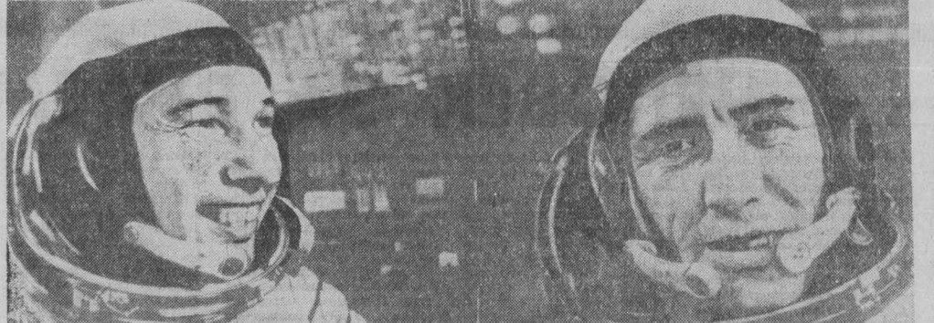
Командир космического корабля «Союз-15» подполковник Геннадий Васильевич Сарафанов и бортинженер космического корабля «Союз-15» полковник Лев Степанович Демина.