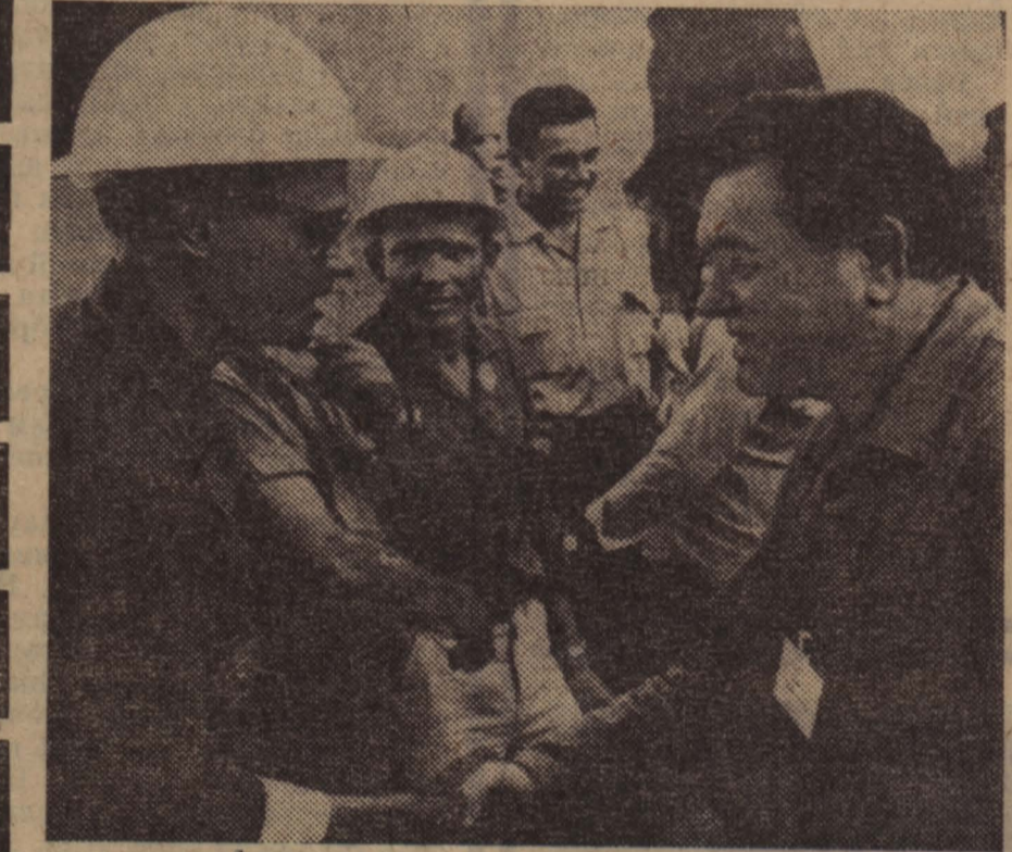
Металлургический завод имени Хосе Марти, расположенный недалеко от Гаваны, был полностью перестроен и оснащен современным оборудованием с помощью Советского Союза и других социалистических стран.

НА СНИМКЕ: товарищеским рукопожатием обмениваются советские и кубинские металлурги после успешного окончания «плавки дружба».