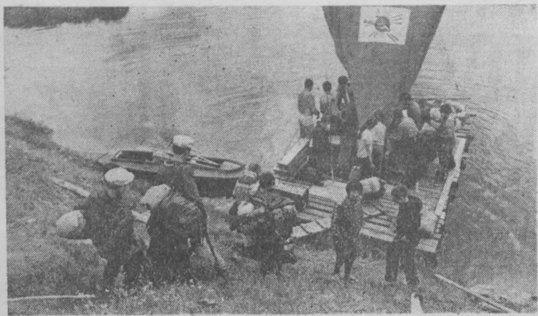
Увлекательное путешествие по воде совершил этот летом 30 восьмиклассников московской школы № 747 под руководством учителя Николая Щербанова. За 30 дней они проплыли на плоту 300 километров по Верхней Волге от селения Селижары до старицы.