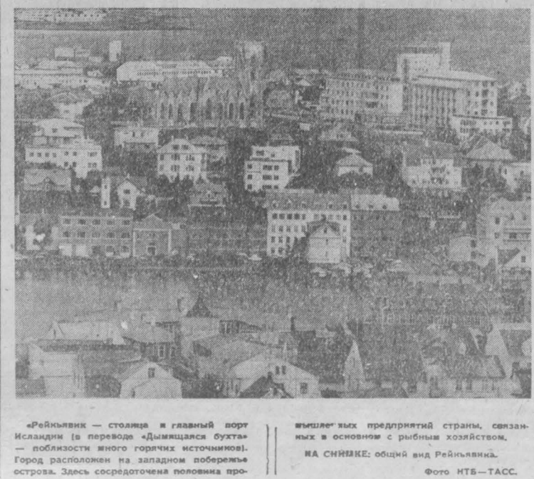
Рейкьявик — столица и главный порт Исландии (в переводе «Дымящаяся бухта» — близость много горячих источников). Город расположен на западном побережье острова. Здесь сосредоточена половина промышленности предпринимателей страны, связанных в основном с рыбным хозяйством. НА СНИМКЕ: общий вид Рейкьявика.

После этих слов рука вожака с кинжалом непроизвольно опустилась. Не мог воспитанный на обожании фюреров эсэсовец переступить черту. — Я есть homo sapiens, — добавил страус на свою бедную голову. — Что? — Он назвал себя разумным, шэф. — Интеллигент, значит, — успокоившись вожак и натренированным движением перевернул страуса глотку. Когда я узнал об этом печальном происшествии, мне стало жаль невнимных страусов, а также тех баварцев, которые не знают мудрых слов Карла Маркса: «Наши, как и женщины, не прощаются минуты оплошности, когда первый встречный авантюрист может совершить над ней насилие». Н. ЛУЗИН. (АПН)