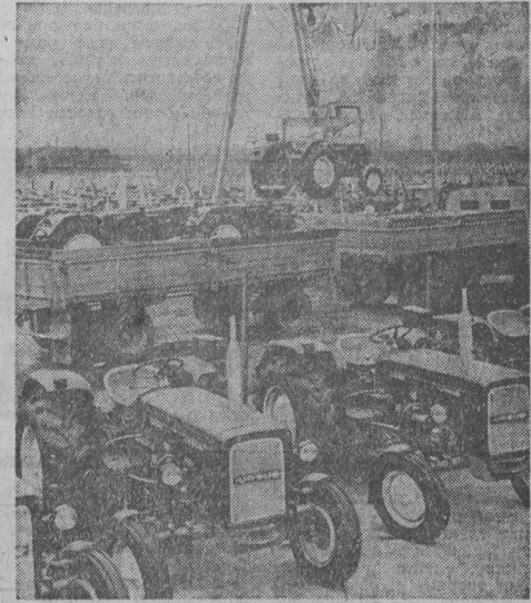
ПНР. 130 типов машин и различного оборудования для сельского хозяйства производит в настоящее время машиностроительные предприятия народной Польши. Большинство машин, сконструированных польскими инженерами, отличается простотой и высокой производительностью. Это тракторы «Урсус», зерноуборочные комбайны типа «Бизон», сенокосилки. Часть сельскохозяйственной техники экспортируется в страны — члены Совета Экономической Взаимопомощи. НА СНИМКЕ: отправка тракторов «Урсус».

После этих слов рука вожака с кинжалом непроизвольно опустилась. Не мог воспитанный на обожании фюреров эсэсовец переступить черту. — Я есть homo sapiens, — добавил страус на свою бедную голову. — Что? — Он назвал себя разумным, шэф. — Интеллигент, значит, — успокоившись вожак и натренированным движением перевернул страуса глотку. Когда я узнал об этом печальном происшествии, мне стало жаль невнимных страусов, а также тех баварцев, которые не знают мудрых слов Карла Маркса: «Наши, как и женщины, не прощаются минуты оплошности, когда первый встречный авантюрист может совершить над ней насилие». Н. ЛУЗИН. (АПН)