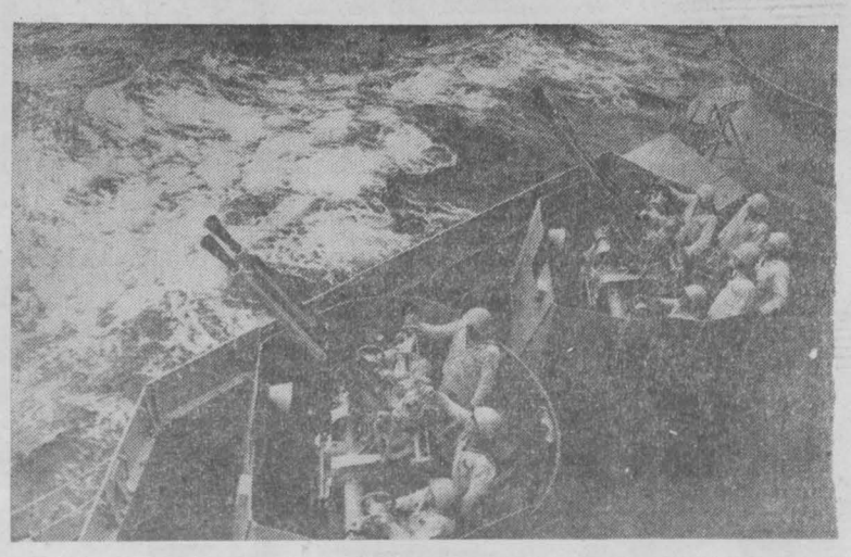
НА СНИМКЕ: в морском походе тренируются расчеты зенитных батарей