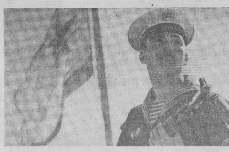
НА СНИМКЕ: отличник Военно-Морского Флота СССР старшина второй Фотохроника ТАСС.