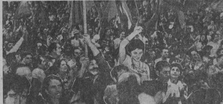
ШВЕЙЦАРИЯ. В Женеве состоялся массовый митинг солидарности с борьбой испанского народа за свободу и демократию...