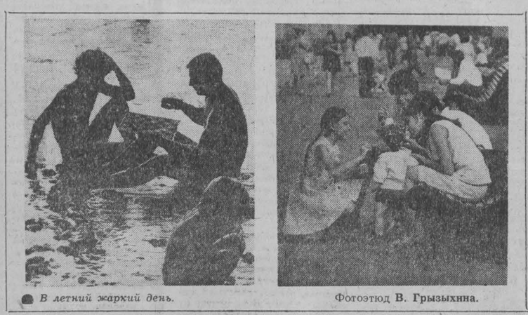
В летний жаркий день.

слесарей по ремонту вагонов, осмотровиков вагонов, проводников пассажирских вагонов, учеников проводников вагонов, электромонтеров. На указанные профессии приглашаются кемеровчале, а проживающие вблизи железной дороги Кемеровского и Толпинского районов. Приняты на работу обеспечиваются форменным обмундированием и бесплатным проездом по железной дороге. За справками и направлениями на работу обращаться в бюро по трудоустройству населения — ул. Трудовая, 4.