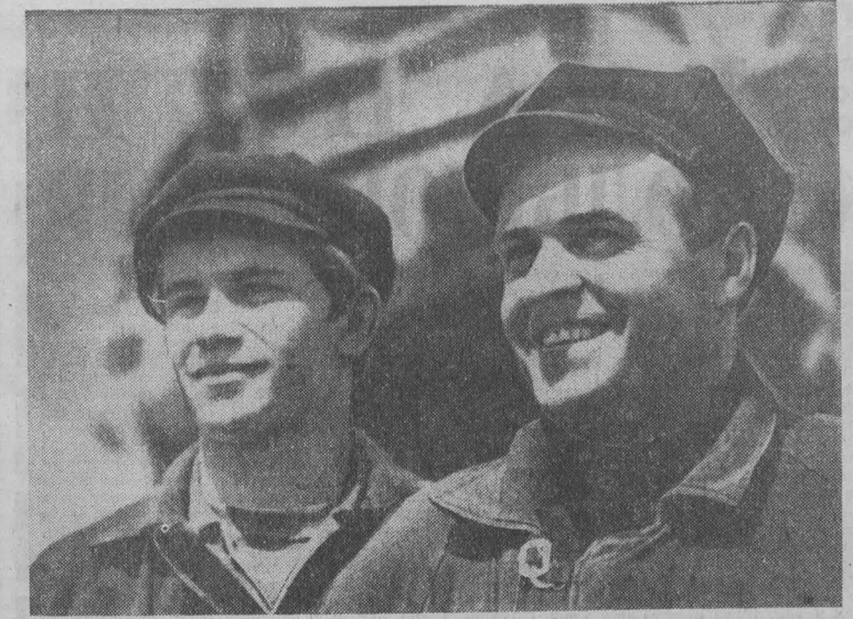
Навстречу Дню шахтера