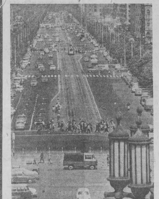
Маршалковская — одна из центральных магистралей Варшавы. Эта прямая, просторная, всегда оживленная улица протянулась на несколько километров, до самого горизонта.